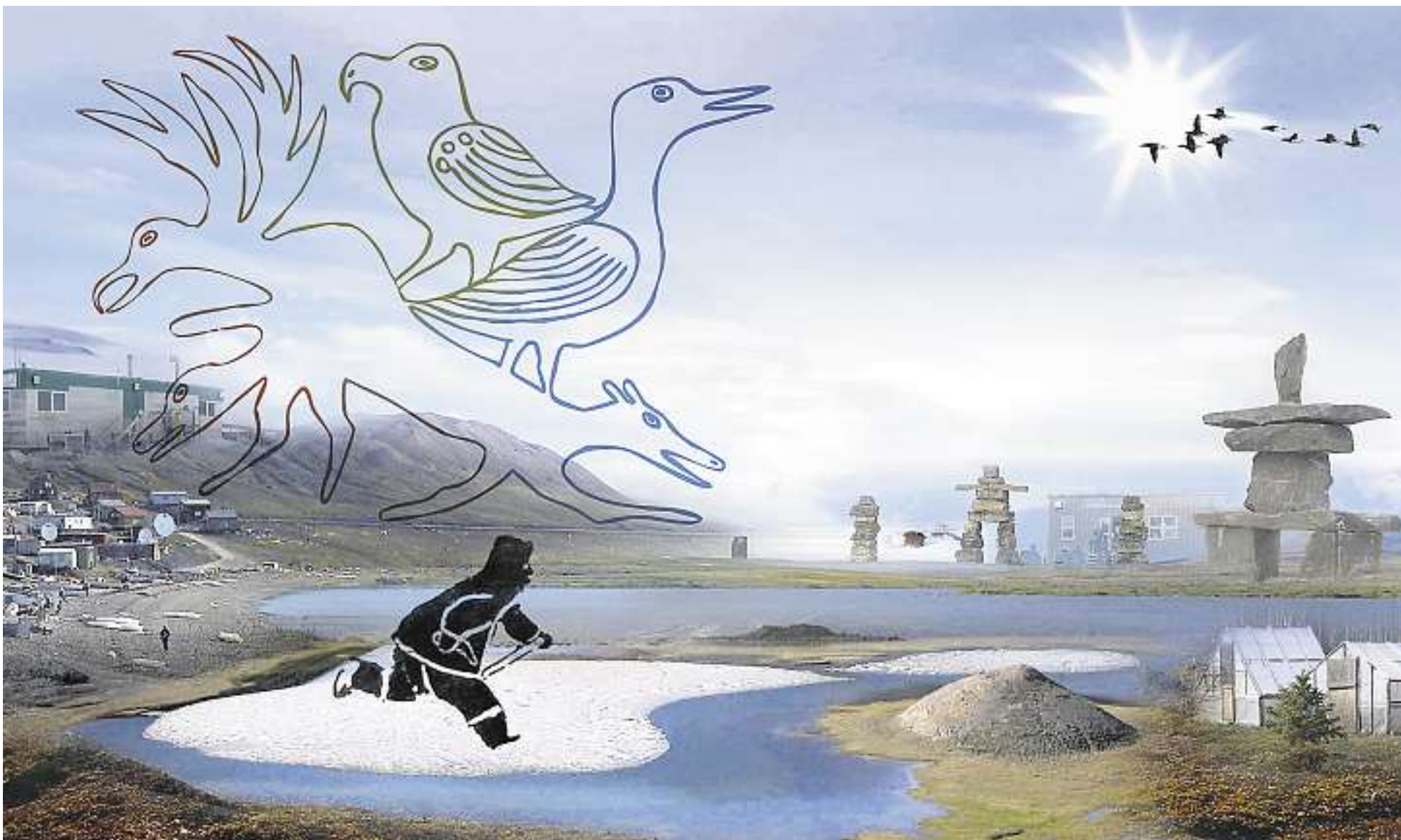
ILLUSTRATION LA PRESSE